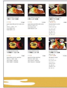
< 6 品目のイメージ >

ご記入いただきました 6~12 品目は主催者側で入力させていただきます。この数を超えるメニューにつきましては、研修会当日に操作方法を体験いただき、各店舗様で追加いただくことになります。