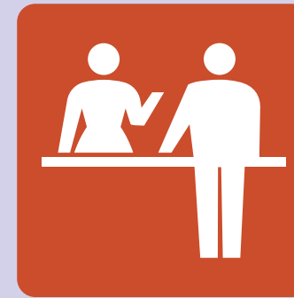
チェックイン / 受付 Check-in / Reception 체크인 / 접수 服务台