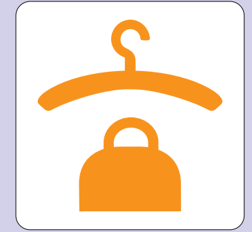
クローク Cloakroom 클럭 衣帽室