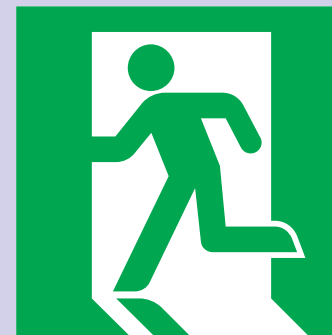
非常口 Emergency exit 비상구 紧急出口