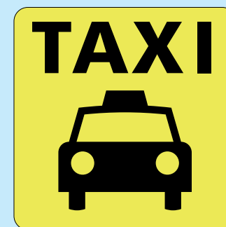
タクシー／タクシー のりば Taxi／Taxi stop 택시／택시승강장 的士／出租车站