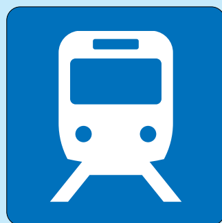
鉄道／鉄道駅 Railway／Railway station 철도／철도역 铁路／铁路站