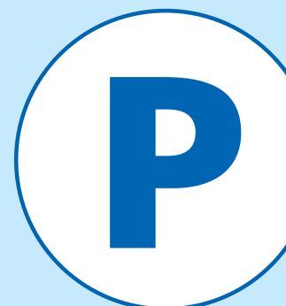
駐車場 Parking 주차장 停车场